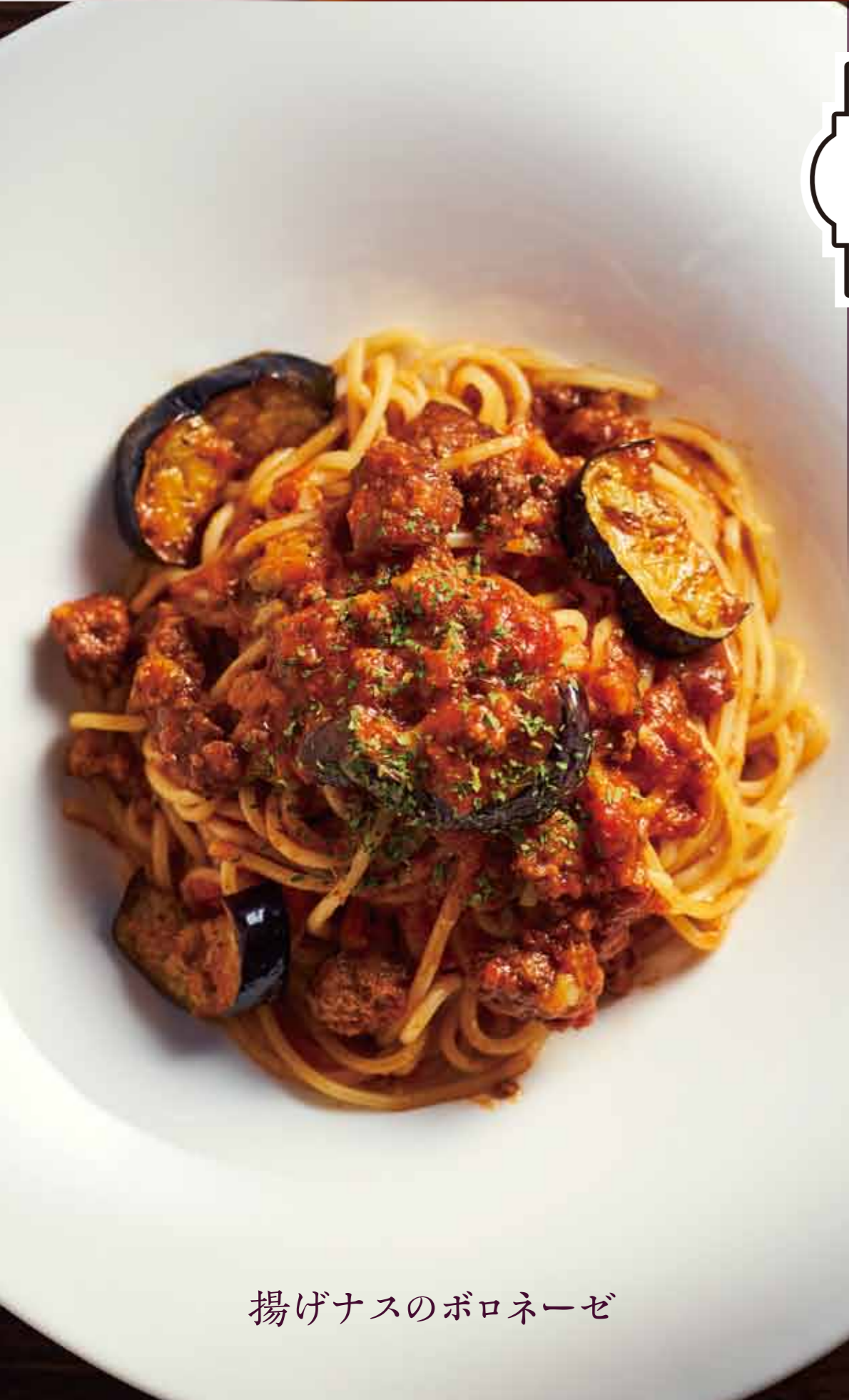
揚げナスのボロネーゼ