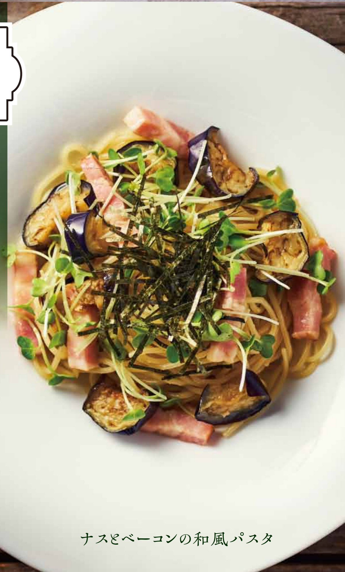
ナスとベーコンの和風 Pasta